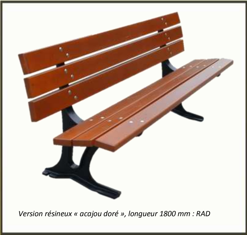
Version résineux « acajou doré », longueur 1800 mm : RAD